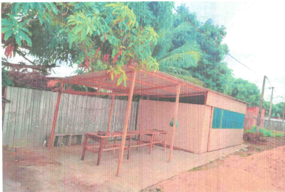
FOTO 03 - REBOCO E LEVANTE BLOCO C