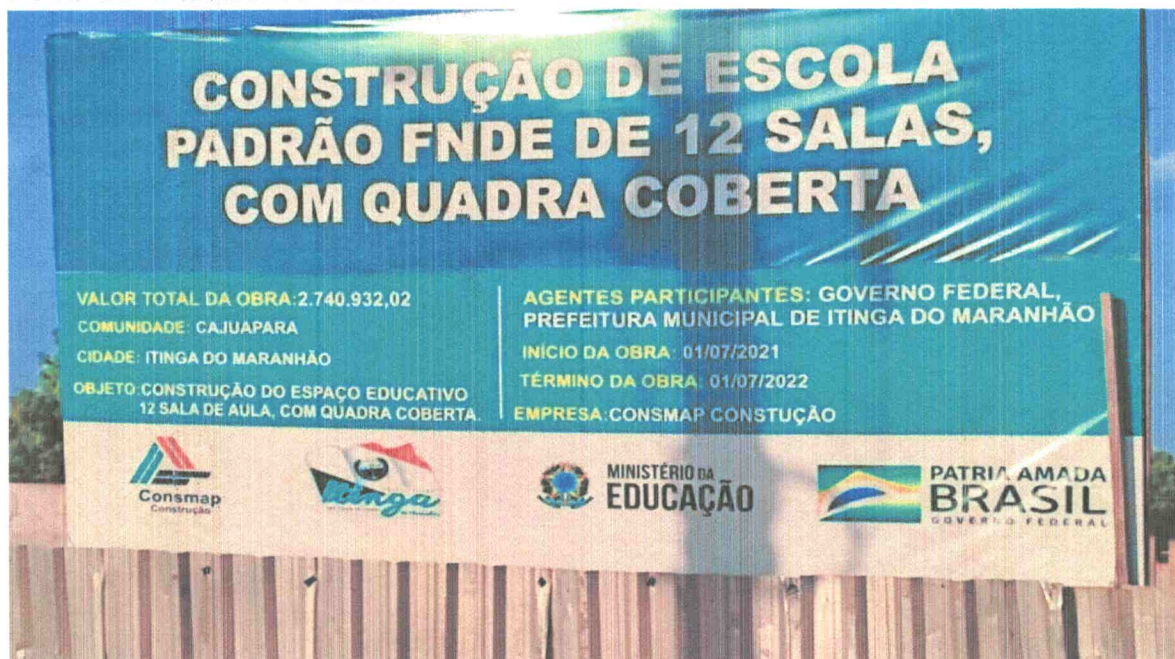
FOTO 01 - PLACA DA OBRA